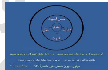
شکل ۰ (دایره عدم اولیه)

و این تصویر دایره‌های خالی [شکل ۰ (دایره عدم اولیه)] نشان می‌دهد که ما قبل از ورود به این جهان از جنس هشیاری «آلست» هستیم، از جنس خدا هستیم، یعنی فرم نداریم و مرکز ما عدم است، و حالا این چهار خاصیتی که ما معمولاً قید می‌کنیم، عقل و حس امنیت و هدایت و قدرت را از مرکز عدم می‌گیریم. در این‌جا ما زنده هستیم و در واقع نشانی از جان داریم، به زندگی زنده هستیم، به خدا زنده هستیم، پر از طرب و شادی هستیم، می‌جنبیم. و پس از این‌که وارد این جهان می‌شویم [شکل ۱ (دایره همانندگی‌ها)]، فرم‌های ذهنی را یعنی با فکرهایمان چیزهای مهم را تجسم می‌کنیم و با آن‌ها همانیده می‌شویم یا هم‌هویت می‌شویم. می‌بینید که هم‌هویت به اصطلاح شدن یک اصطلاح بامعنی است.