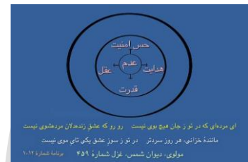
شکل ۰ (دایره عدم اولیه)