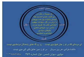
شکل ۱ (دایره همانندگی‌ها)