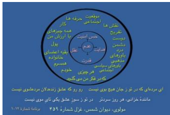
شکل ۲ (دایره عدم)

پس شما با این بیت باید به خودتان نگاه کنید که آیا من روزبه‌روز در اثر عشقی که از زنده‌دلی مثل مولانا صادر می‌شود زنده‌تر می‌شوم یا روزبه‌روز مرده‌تر می‌شوم؟ حالا من اجازه می‌خواهم که به آن چندتا تصویر نگاه بکنیم و یک خرده توضیح بدهیم، برگردیم به اشعار دوباره. پس همین‌طور که می‌بینید بوی یعنی نشان، اثر.