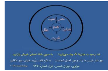
شکل ۰ (دایره عدم اولیه)

اما برای این که ببینیم که ما چند جور جان داریم، به این شکلها توجه کنیم، دوباره برگردیم. [شکل ۰ (دایره عدم اولیه)] می بینید که قبل از ورود به این جهان ما از جنس اصطلاحاً می گوئیم آلت هستیم، از جنس خدا هستیم. این از جنس خدا بودن را، از جنس زندگی بودن را یا از جنس هشیاری بودن را مولانا با واژه آلت بیان می کند که از آیه قرآن می آید که بارها توضیح دادیم.